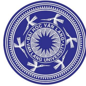
a. Logo năm 1995 [4]

định sứ mệnh đào tạo nguồn nhân lực tương lai cho đất nước, vươn tầm thế giới. Hình dáng chiếc khiên truyền thống của logo chính của Trường đã được cách điệu thành hình dáng chữ U mềm mại, để có thể sử dụng đa dạng hơn trong nhiều trường hợp ứng dụng. Hình ảnh chim lạc vẫn được giữ nguyên ở vị trí chính giữa logo, nhưng được tinh chỉnh cô đọng hơn, tạo cảm giác vút bay, vươn lên những tầm cao mới.