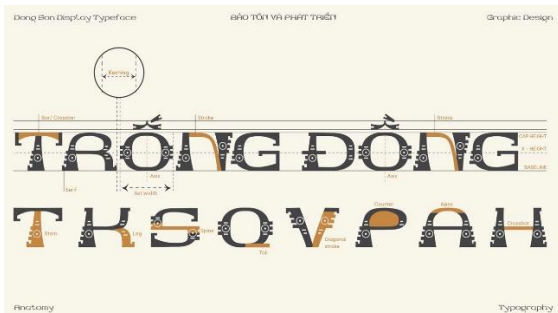
a. Hình ảnh bộ chữ [1]

Đồ án tốt nghiệp Hệ thống đồ họa chữ Thiết kế bộ chữ lấy cảm hứng từ Đông Sơn “Dong Son display typeface” do sinh viên Lý Đoàn Hải Yến thực hiện [1]. Đồ án thiết kế một bộ chữ gồm 24 chữ cái, ký tự đặc biệt, chữ số và bộ dấu, lấy cảm hứng từ ký tự và hoa văn trống đồng Đông Sơn. Bộ chữ được phát triển dựa trên các hoa văn có độ nhận diện cao như các hoa văn chấm tròn, lấy từ hình ảnh hoa văn nhà sàn hay hoa văn mắt động vật; những hoa văn hình răng lược lấy từ hoa văn chim lạc hay vạt áo của người múa. Những hoa văn này rất đặc trưng trên trống đồng Đông Sơn, đã được sinh viên biến đổi, kết hợp thành những đặc trưng của một bộ chữ viết có tính thẩm mỹ riêng biệt, độc đáo và mang tính ứng dụng cao.