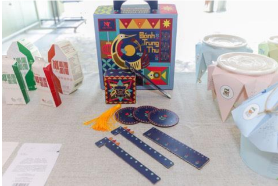
Hình 2. Dự án Bánh Trung thu Kinh Đô [5]

xong, có thể tách các mảng nền đã đục, tái chế thành các chiếc lồng đèn để chơi hoặc bộ dụng cụ ăn uống. Với cách thể hiện tinh tế, chu đáo, sáng tạo trong thiết kế, đồ án thể hiện được tinh thần của nhãn hàng, các giá trị truyền thống nhân văn gắn kết gia đình mà sản phẩm muốn mang tới cho trải nghiệm người dùng.