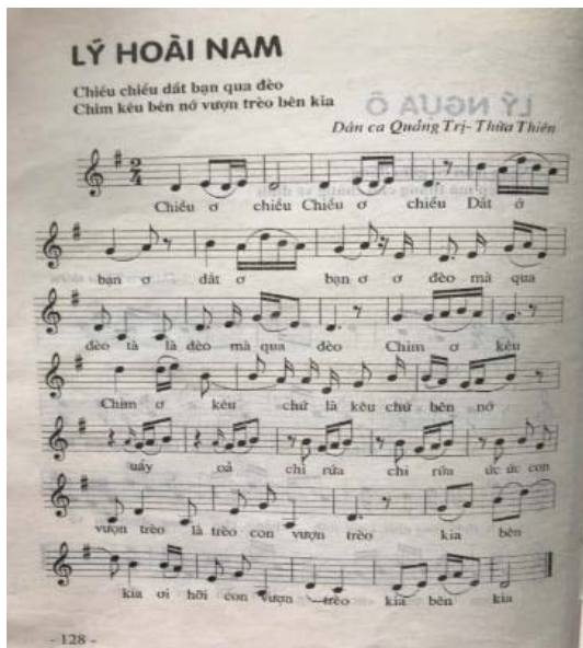
Hình 2. Lý Hoài nam [1, tr.128]

Hò Mái Nhì, Hò Mái nện (dân ca Quảng Trị - Thừa Thiên). Nếu không tính những chữ đệm, ta sẽ thấy bài Lý Hoài nam [1, tr.128] dưới đây là câu thơ lục bát: Chiều chiều dất bạn qua đèo/Chim kêu bên nó vượn trèo bên kia.