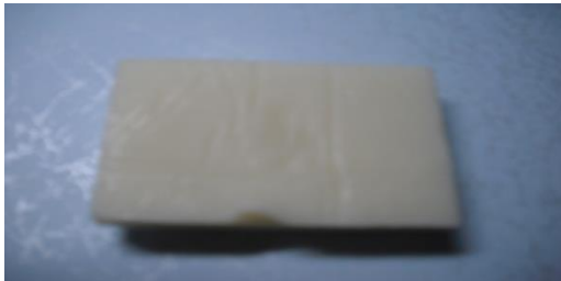
Hình 2. Xà phòng với NaOH 25% Mẫu 2

Mẫu 1: Xà phòng bánh được sản xuất với NaOH nồng độ 25%.