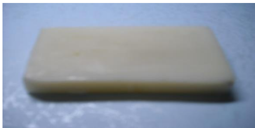
Hình 3. Xà phòng với NaOH 30% Mẫu 3: xà phòng bánh được sản xuất với NaOH nồng độ 35%.