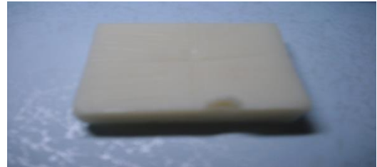
Hình 4. Xà phòng với NaOH 35%

Chất lượng 3 mẫu được thể hiện ở bảng sau: